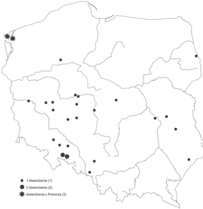
Rys. 1. Rozmieszczenie stwierdzeń czajki towarzyskiej w Polsce Fig. 1. Distribution of Sociable Plover records in Poland. (1) – 1 record, (2) – 2 records, (3) – records in Pomerania