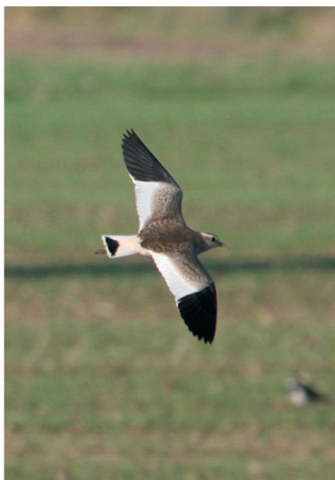
Fot. 1–3. Czajka towarzyska, Zagórze, 30.09.2010 (zdjęcie górne;); 18.10.2010 (zdjęcia dolne;)